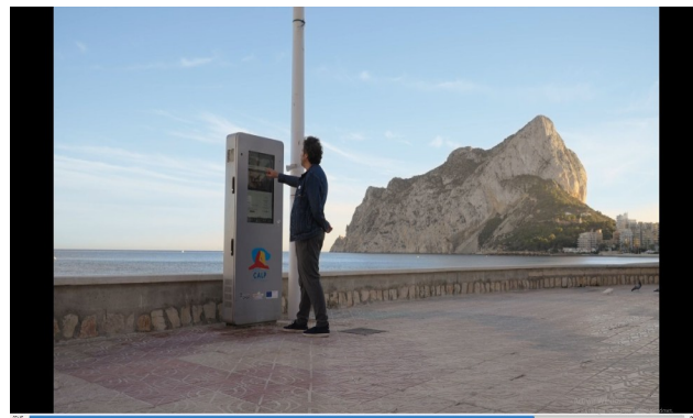
spot TV provincial

Además, se ha llevado a cabo una campaña publicitaria en televisión provincial con sobreimpresiones, cuñas de radio regional y a través de Facebook e Instagram en los que se ha difundido un vídeo en formato reel.